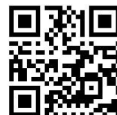
島ヶ原日和 QR コード

デジタル化の一つは地域住民や各種団体からの自発的な情報発信ツールとしてのブログ「島ヶ原日和」です。まち協および広報部会は情報発信のガイドラインを設定し、その発信内容の確認等をおこなう支援者としてかわります。始まったばかりですが、右の QR コードをスマホで読み込みアクセスしてみてください。